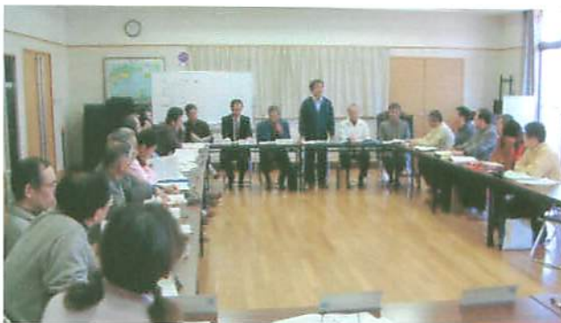
3月19日に開かれた17年度自治連総会