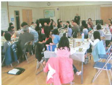
地域の人々と語り合う南っ子たち