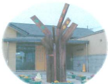
まちのシンボル「ひと・まち・ゆめ」