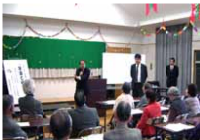
税金の話に耳を傾ける住民

この日講師を務めたのは草津税務署の三好さんと堤さん。個人課税では、所得税の計算方法