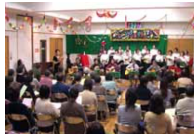
ふれあいミュージックソン

また夜の部は「ふれあいクリスマスパーティー」。午後6時から、公民館で活動しているカラオケやダンスサークル、地域で活躍している軽音楽グループが生演奏。カラオケの歌声、生演奏に合わせてダンスを楽しむなど大いに盛り上がりました。