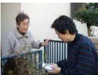
お寿司を手渡す社協役員