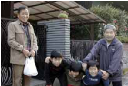
イモごはん慰問する南小児童

志津南小学校5年生32人が12月1日の午後、4班に別れて地域独り暮らしのお年寄りや日頃お世話になっている市民センターを訪ね、手作りのおいもご飯をプレゼントしました。