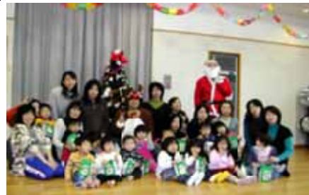
「おやこっこ」のクリスマス会