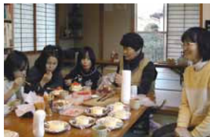
楽しくケーキづくり

出来上がったオリジナルケーキをみんなでお楽しみました。折り紙でサンタさんを折ったり、お絵かきなどをして一足早いクリスマスを楽しみました。なお新年は1月10日（水）から文庫を開いています。本好きな方たちのお越しをお待ちしています。(若草文庫)