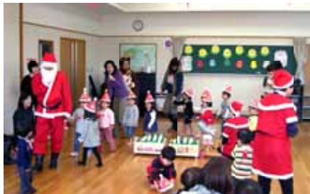
「たんぼぼ」のクリスマス会

クリスマスの飾りつけも華やかな市民センター館内は、サークルが作ったリースや装飾品な