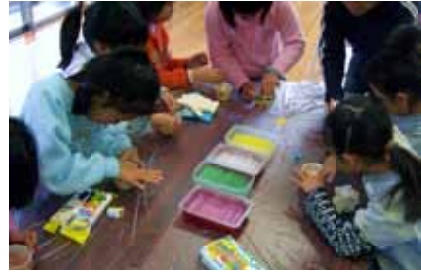
キャンドルホルダー作り