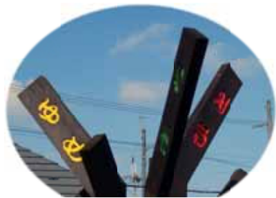
まちのシンボル「ひと・まち・ゆめ」