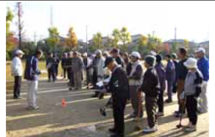
ルールの説明を受ける参加者

志津南地区社会福祉協議会は12月15日、地域ふれあい事業の一つとして、85歳以上の高齢者19人にバラ寿司を配りました。