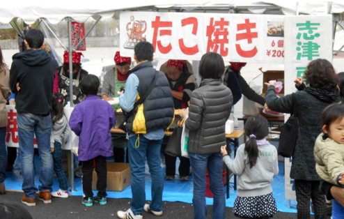
志津南地区出店のたこ焼きに行列

志津南地区も昨年に続き2回目の参加となり、「たこ焼き」を出店した。大変よく売れ午後1時ごろには売り切れ状態となり急ぎ追加の買い出しに走り、518パック(1パック6個)を完売しました。