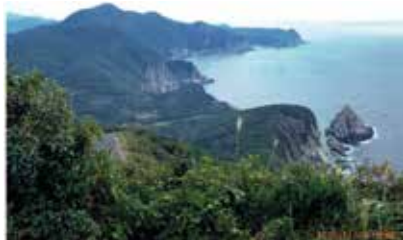
対馬の島豆酸崎断崖

望高台からの浅茅湾内の遠望はリアス式海岸で、周囲160平方キロに及ぶ大小の入江と無数の半島が突出し、また大小の島々が散在していて、一日中眺めても厭きない光景でした。また、山岳が多いので川は清流で滝も多く、北端の展望台か