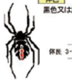
体色 黒色又は濃い褐色