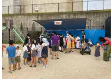
「射的」コーナーにできた子ども達の列

現下のコロナ禍では以前のような大規模な夏祭り開催は困難な状況ですが、子ども世帯の多い当組は小規模を活かして何とか開催できないか、との思いで準備してまいりました。