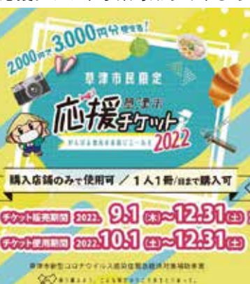
応援チケット事業専用サイトより

草津市では、昨年に続き、新型コロナウイルス感染症拡大により打撃を受けている地域経済の活性化を図る目的で「草津市応援チケット事業2022」を実施しています。