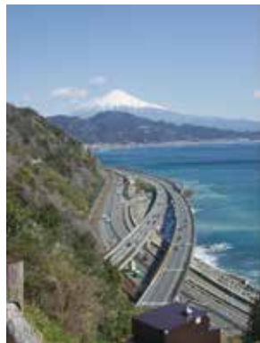
景絶の絶景は拝めたも 2度ほど訪れました。

の2回目は月曜日のせいのか?由比駅周辺で営業している飲食店は皆無!電車で清水駅まで戻っても食堂は見当たらない!仕方なく駅そばのコンビニ前で路上屋