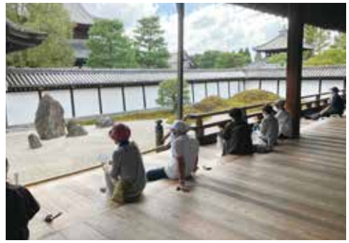
「八相の庭」を眺める参加者たち