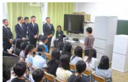
お礼の言葉を述べる児童代表

5月11日、六年三組の教室でパナソニック株式会社よりの冷蔵庫受贈式が行われました。熱中症対策として、同社より草津市内の小中学校へ寄贈していた