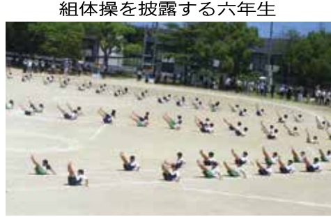
組体操を披露する六年生

5月30日、「南っ子わくわく運動会」が開催されました。「みんなが全力、心を一つに三色魂」のスローガンのもと、全