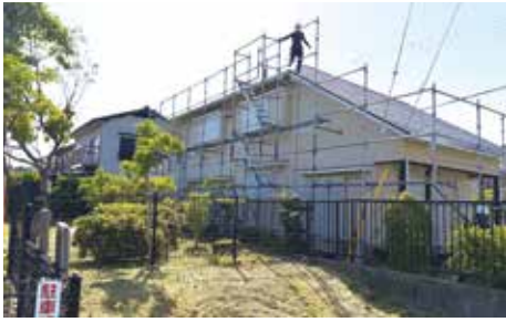
足場が組まれた工事中の集会所

5月23日、若草第三集会所の雨樋補修工事が完了しました。集会所を活動拠点としている