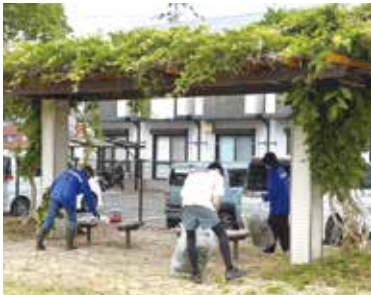
公園を清掃する参加者

現在、昨年度に策定した「地区防災計画」をベースに、各町内の実情に寄り添った計画へのブラッシュアップを進めています。立命館大学の学生の皆さんが新たな頼もしい力として参加してくれており、こうした若い力と共に、持続可能な地域防災の仕組みづくりを目指していきます。